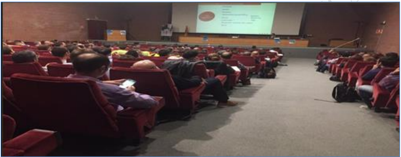
Jornadas Análisis de perfiles criminales de la EEC en el Instituto de Seguridad de Cataluña.

Este término que nos define, del latín “securitas”, implica ausencia o minimización de riesgos, en los avatares de la vida, (incluida la profesional), lo que también supone, a contrario sensu de la llegada a una situación de cero riesgos, que a pesar de que de manera insospechada y, paradójicamente, muchas son las personas y profesionales del sector, en realidad, pocos, los que en espíritu y afán de ser los mejores en su faceta formativa, la vivimos con vocación, haciendo de ella la prestación de un SERVICIO SEGURO de calidad y satisfacción.