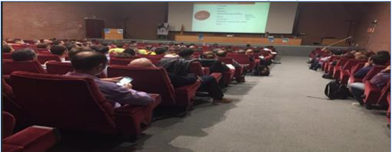
Jornadas Análisis de perfiles criminales de la EEC en el Instituto de Seguridad de Cataluña.

Este término que nos define, del latín “securitas”, implica ausencia o minimización de riesgos, en los avatares de la vida, (incluida la profesional), lo que también supone, a contrario sensu de la llegada a una situación de cero riesgos, que a pesar de que de manera insospechada y, paradójicamente, muchas son las personas y profesionales del sector, en realidad, pocos, los que en espíritu y afán de ser los mejores en su faceta formativa, la vivimos con vocación, haciendo de ella la prestación de un SERVICIO SEGURO de calidad y satisfacción.